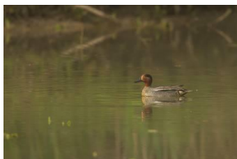
Sarcelle d'hiver (C. Rousselle)

Sortie sur la journée (9h – 17h), repas tiré du sac.