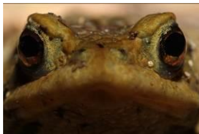
Crapaud commun

Pour les sorties, prévoyez des chaussures de marche. Des vêtements sans couleurs vives sont recommandés pour les sorties ornithologiques.